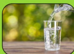
Wasser gibt es GRATIS!