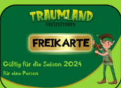
Freikarten für unseren Freizeitpark