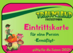
Tickets zu tollen Konditionen für Familie und Freunde