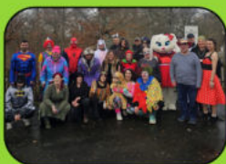
Viele tolle Events (Chefs grillen, Weihnachtsfeier, Ausflüge)