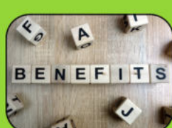
Rabattcodes über die Coperate Benefits Plattform