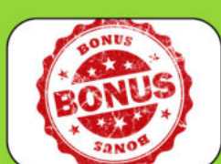
Anwesenheitsprämie (wird zum Vertragsende ausbezahlt)