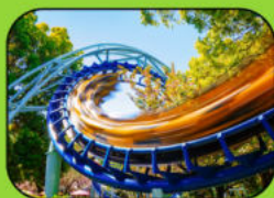
Freier Eintritt in Partner Freizeitparks