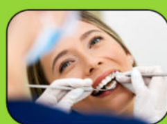
Betriebliche Gesundheitsvorsorge (ab 1 Jahr Zugehörigkeit)